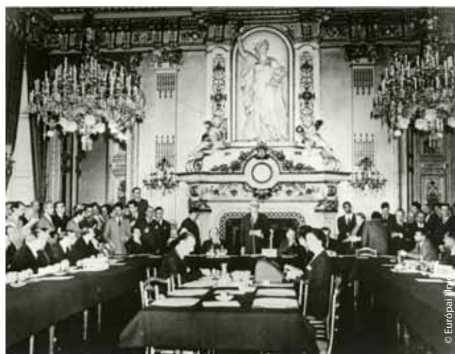
1950. május 9.: Schuman híres beszédét tartja. E napot tartják ma az Európai Unió születésnapjának.

Beszéde meghallgatásra talált, ugyanis Adenauer német kancellár azonnal pozitív válasszal reagált, de így tett a holland, a belga, az olasz és a luxemburgi kormány is. E hat alapító állam egy éven belül, 1951. április 18-án írta alá a Párizsi szerződést, létrehozva ezzel az Európai Szén- és Acélközösséget, Európa első, nemzetek felett álló közösségét. Ez az úttörő jelentőségű szervezet készítette elő a terepet az Európai Gazdasági Közösség, ezáltal pedig az Európai Unió számára, amelyet a mai napig az 1950-ben megálmodott innovatív európai intézmények vezetnek.